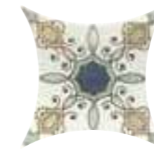
COLONIAL KITE CHARLESTON 16,5 x 16,5 (G 84) 6,5" x 6,5" m²