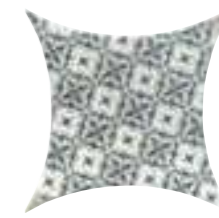
COLONIAL KITE JAMESTOWN 16,5 x 16,5 (G 84) 6,5" x 6,5" m²

MÓDULO FORMADO POR PATERN MADE BY / MODULE COMPOSÉ DE 2 COLONIAL PETAL + 1 COLONIAL KITE