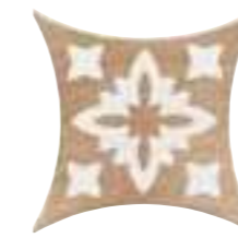
COLONIAL KITE NEWPORT 16,5 x 16,5 (G 84) 6,5" x 6,5" m²