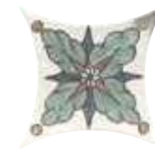
COLONIAL KITE ANNAPOLIS 16,5 x 16,5 (G 84) 6,5" x 6,5" m²